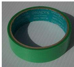
④マスキングテープ